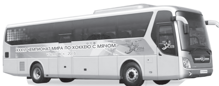
Вот такие красивые автобусы будут курсировать по Ульяновску всего через год.

- Кроме того, в ближайшем будущем мы планируем увеличить вместимость центрального стадиона в два раза, - пояснил Сергей КУЗЬМИН. - Но эти работы уже будут вестись к чемпионату мира по футболу 2018 года, и здесь мы рассчитываем на помощь из федерального бюджета.